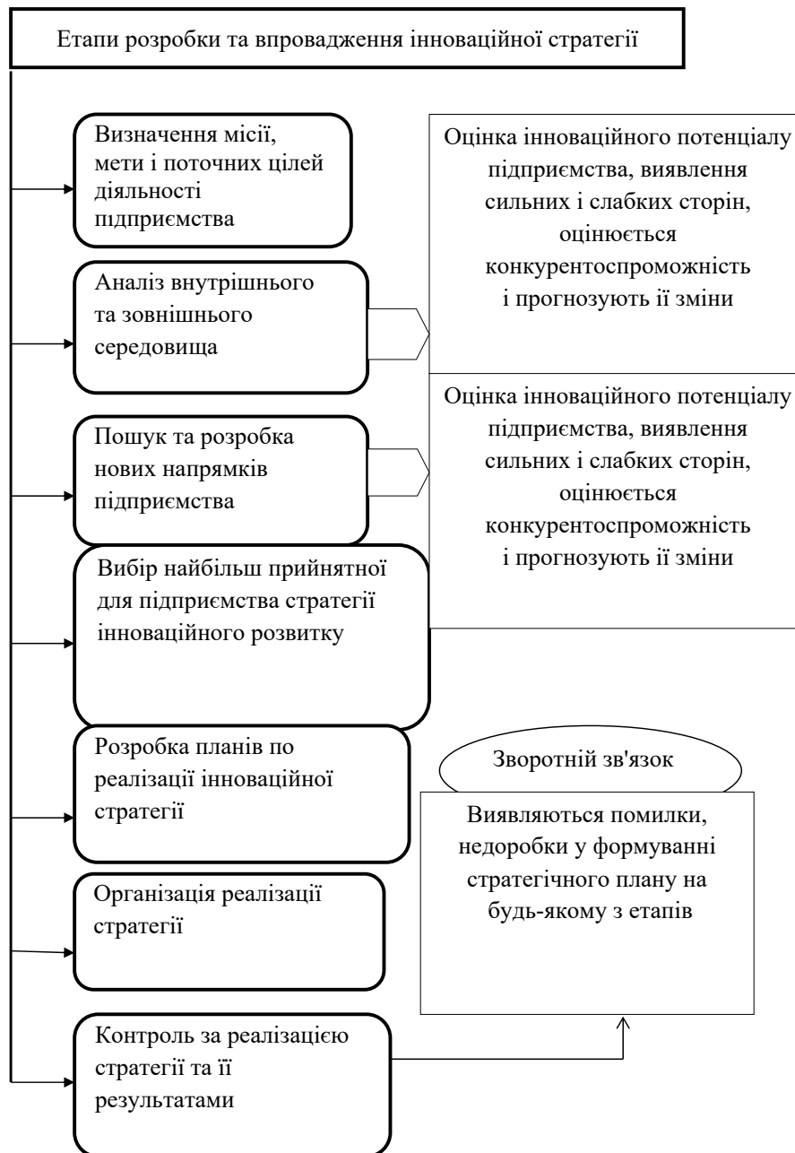
Рис. 2. Схема розробки та реалізації інноваційної стратегії [4, с. 117]

кої кваліфікації всіх виконавців, потребує проведення широкого спектра досліджень і оцінювання альтернативних варіантів рішень, які найбільше відповідають іміджу й завданням організації. Для розробки та здійснення інноваційної стратегії необхідні висококваліфіковані спеціалісти – сучасні менеджери, підприємці, які здатні забезпечувати інноваційний розвиток підприємству. Можна вважати, що стратегія була реалізована успішно, якщо результати, що отримані в результаті реалізації обраної інноваційної стратегії, посилити стан підприємства та сприяли його якісному розвитку. Якщо результати не сприяли досягненню обраних пріоритетів, необхідно поглибити аналіз зовнішнього середовища та інноваційного потенціалу з метою вивчення причин відхилень та скоригувати визначені цілі, пріоритетні напрямки розвитку та обрану інноваційну стратегію.